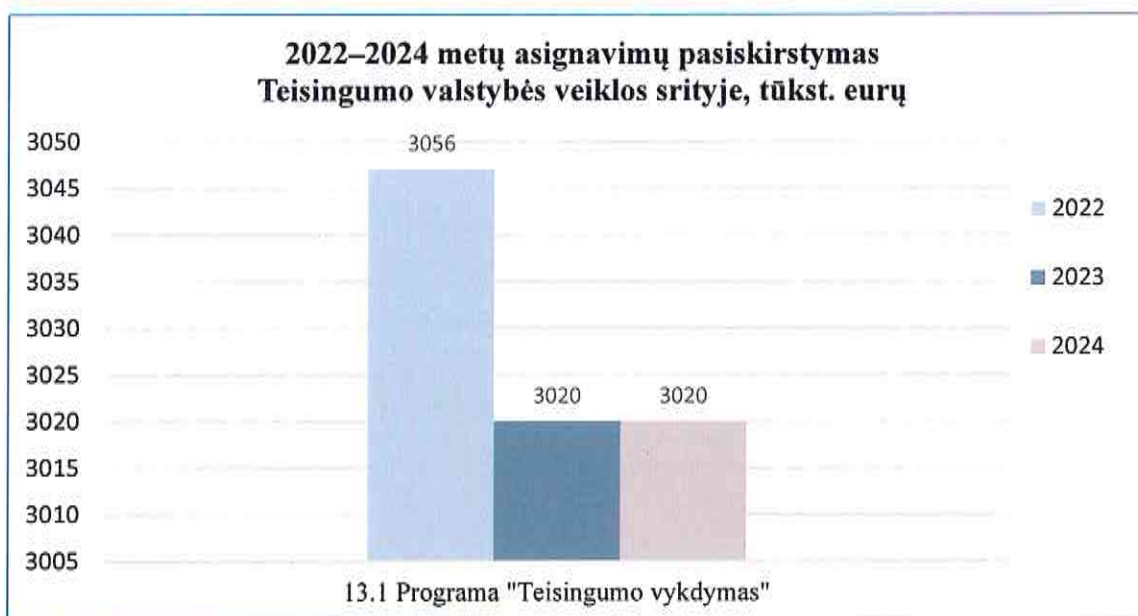
1 grafikas. 2022– 2024 metų asignavimų pasiskirstymas pagal programas